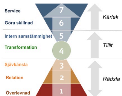
CTT, R Barret

Verktyget finns för individer, små och stora grupper, hela företag, organisationer och hela nationer. Verktyget finns särskilt anpassat mot all sorts skolverksamhet samt som 360° feedback på chefers ledarskap.